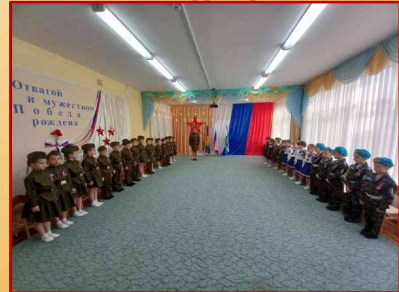
Группы ДОУ на территории СОШ 17